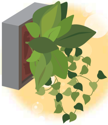
水やりも、壁掛けの状態のままできるものがポピュラーです♪

ングラータといった人気の植物が寄せ植えされた状態なので、すぐ飾ることが出来ます。