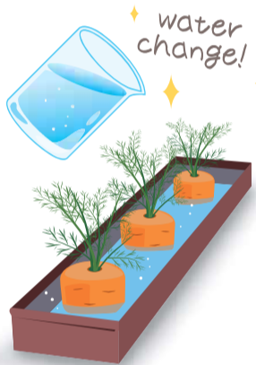
にんじんのヘタの水は毎日替えましょう

もっと気軽に、ということなら、土のいらぬ植物・エアープランツをいくつか小皿に乗せてダイニングなどに飾るのはいかが？エアープランツは時々陽に当て、乾燥したら涼しい時間帯に時々霧吹きで水をあげるだけで手入れが比較的簡単。側にお茶用のお砂糖などを小さいタンブ