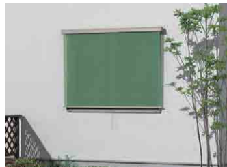
Basic style フック固定タイプ

※一般複層ガラスの窓にスタイルシェードを使用した場合の性能です。関連JISなどに基づき計測および算出した値であり、保証値ではありません。