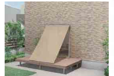
Deck style デッキ固定タイプ