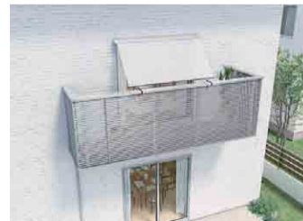
Balcony style 手すり固定タイプ