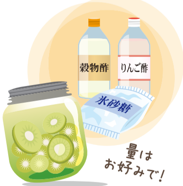
果実酢は穀物酢やりんご酢がさっぱり味おすすめ。氷砂糖の量は好みで調整してくださいね。

いちごなど、さまざまな味を楽しんで楽しんでみては？果物の量に対して、お酢と氷砂糖の量は、それぞれ同量〜2倍が目安。皮をむいてお好みの大きさにカットしたら清潔なビンに入れ、氷砂糖とお酢を入れます。冷暗所で保存し、1日1回はゆすりましょう。1週間ほどで飲みごろになります。果実酢は、漬け込んだ果物と一緒に牛乳や豆乳と合わせてミキサーにかければスムージーとして楽しめますし、バニラアイスに加えてもいいですよ！