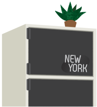
100円ショップのプラスチックドアに英字のステッカーを貼るなどさらにアレンジすればもっと素敵になりますよ。

カラーボックスに扉をつければ、よりおしゃれな家具にグレードアップ！100円ショップのカラーボックス用のプラスチックドアなら、付属のパーツに両面テープでカラーボックスに取り付けるだけでOKです。サイズが合えばコルクボードもグッド！すのこをカラーボックス全体の扉に使えば、カントリーテイストに仕上がります。