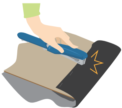
マットづくりは、タッカーがなかったら、ホチキスを開いた状態で芯が出るところを強く押せば留められます。

2 カバー用の布を裏側に広げ、その上に天板用の板を置く 3 布を引っ張りながら板ごと布をくるみ、周りをタッカーで留める。 天板用の板はホームセンターでサイズに合わせてカットしてもらえますので、事前にサイズを測りましょう。インテリアの幅が広がるカラーボックス。どんどんアレンジして楽しく使ってくださいね！